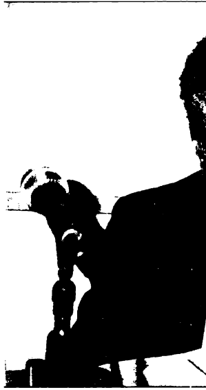
١٩٩٤/٣/٢٦ في يوم